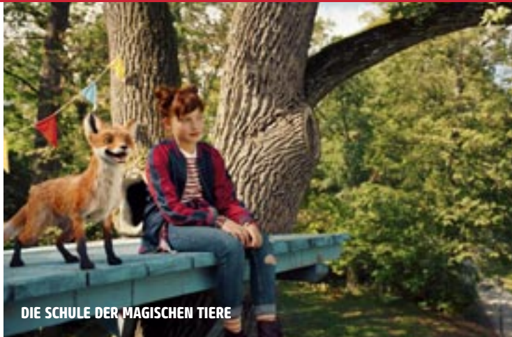
DIE SCHULE DER MAGISCHEN TIERE

BOSS BABY SCHLUSS MIT KINDERGARTEN US 2021, 92 Min., FSK ab 6 Jahren Regie: Tom McGrath